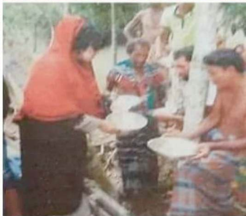
Food distribution among flood victims by Nari Mukto Kontho Samajkallyan Songstha.