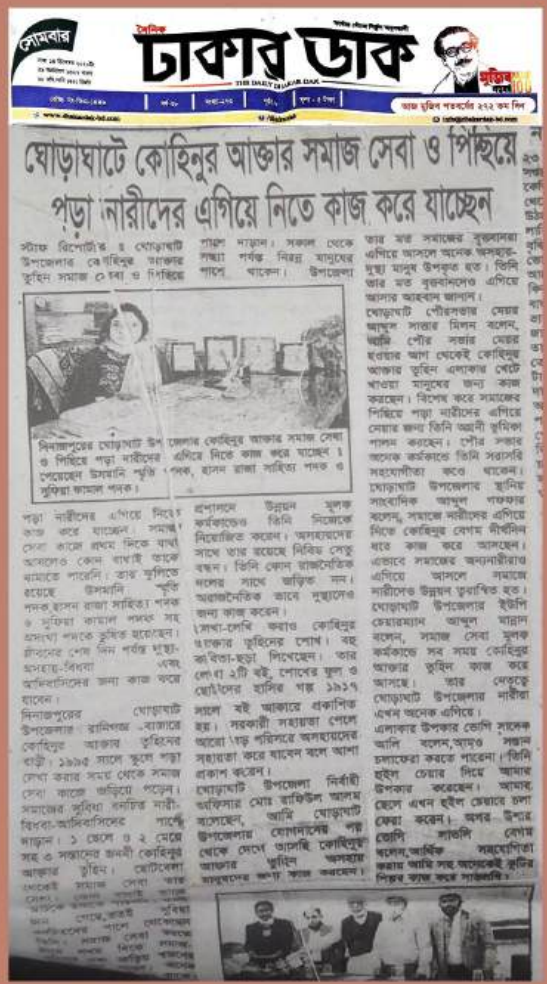
দিনাজপুরের ঘোড়াঘাট উপজেলার কোইনুর আজর তুহিন শিহিয়ে পড়া নারীদের এগিয়ে নিতে কাজ করে যাচ্ছেন। কোন বাধাই তাকে থামাতে পারেনি। ইসলামি স্মৃতি পদক, হালন রাজা সাহিত্য ও গুরুত্বা কামাল পদক সহ অসংখ্য পদকে ভূষিত হয়েছেন তিনি।