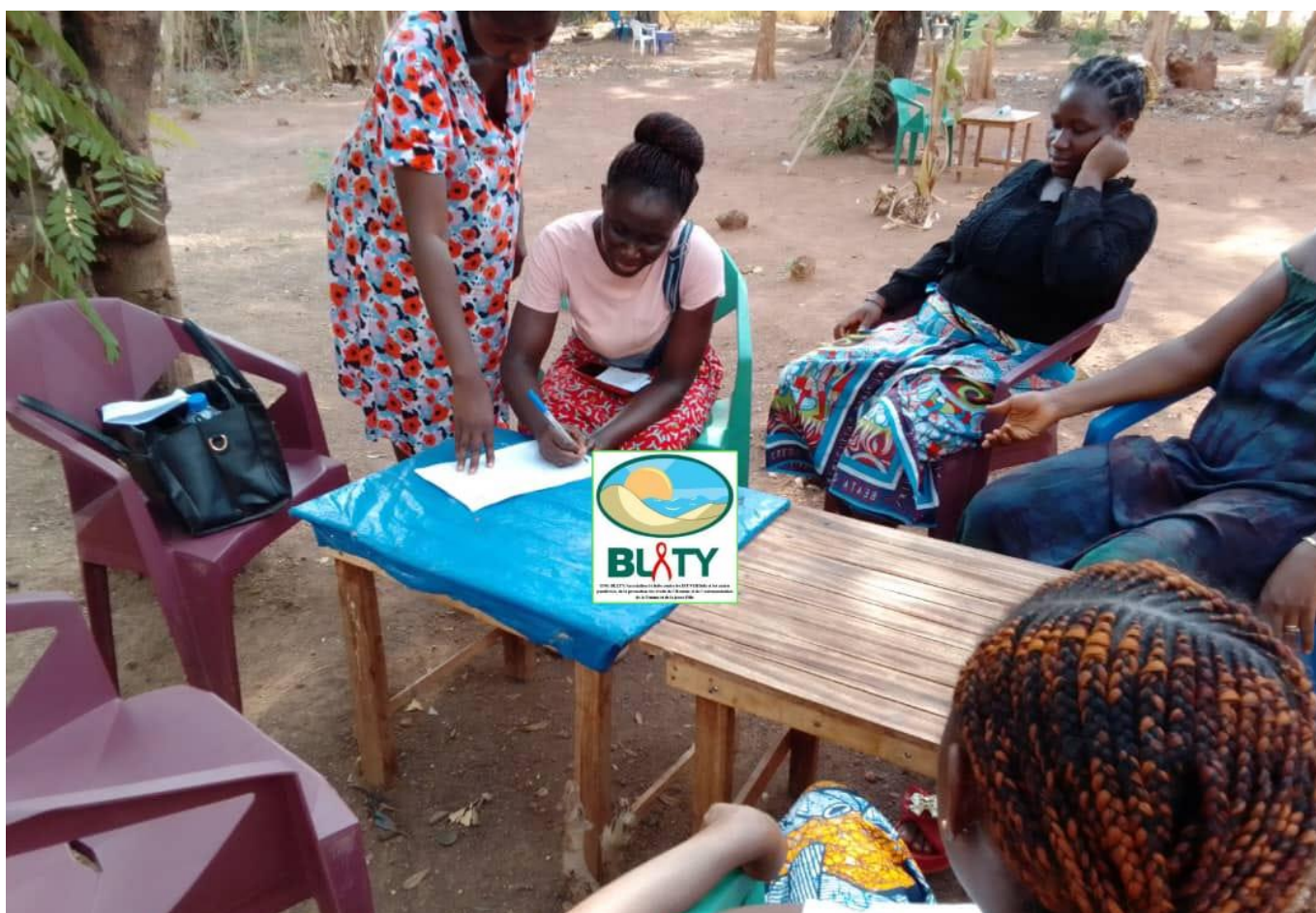
BLETY : Séance de sensibilisation de groupe