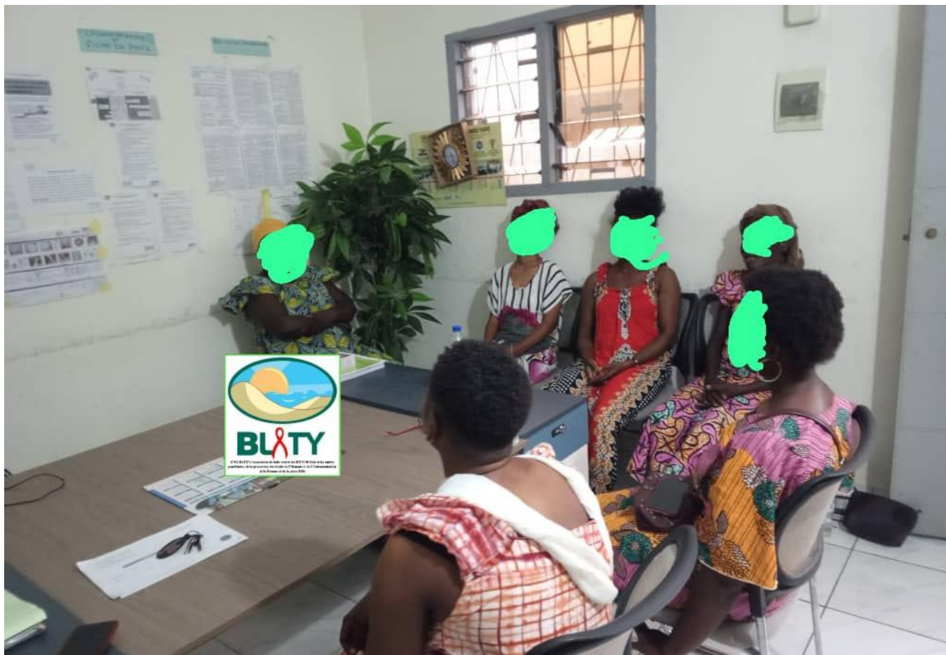
BLETY : Séance de groupe de soutien SIKENSI