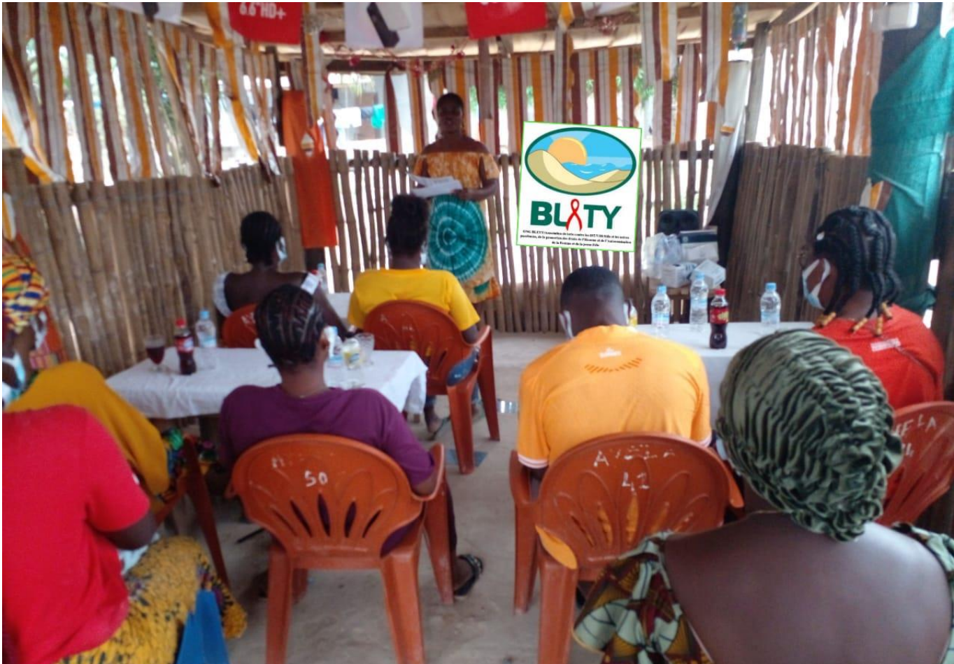
BLETY: Séance de groupe de soutien DABOU