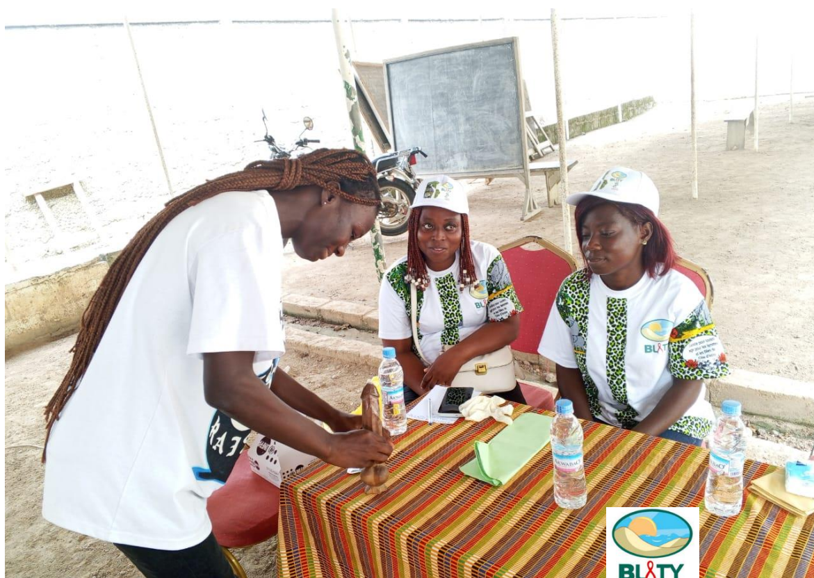
BLETY : Séance de sensibilisation des JFVES dans le district de SIKENSI