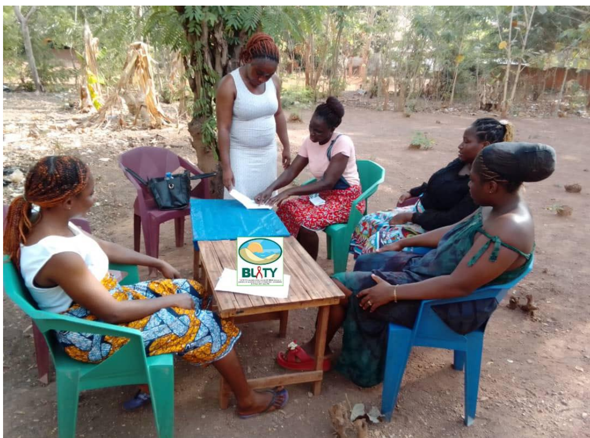
BLETY : Séance de sensibilisation des JFVES dans le district de DABOU