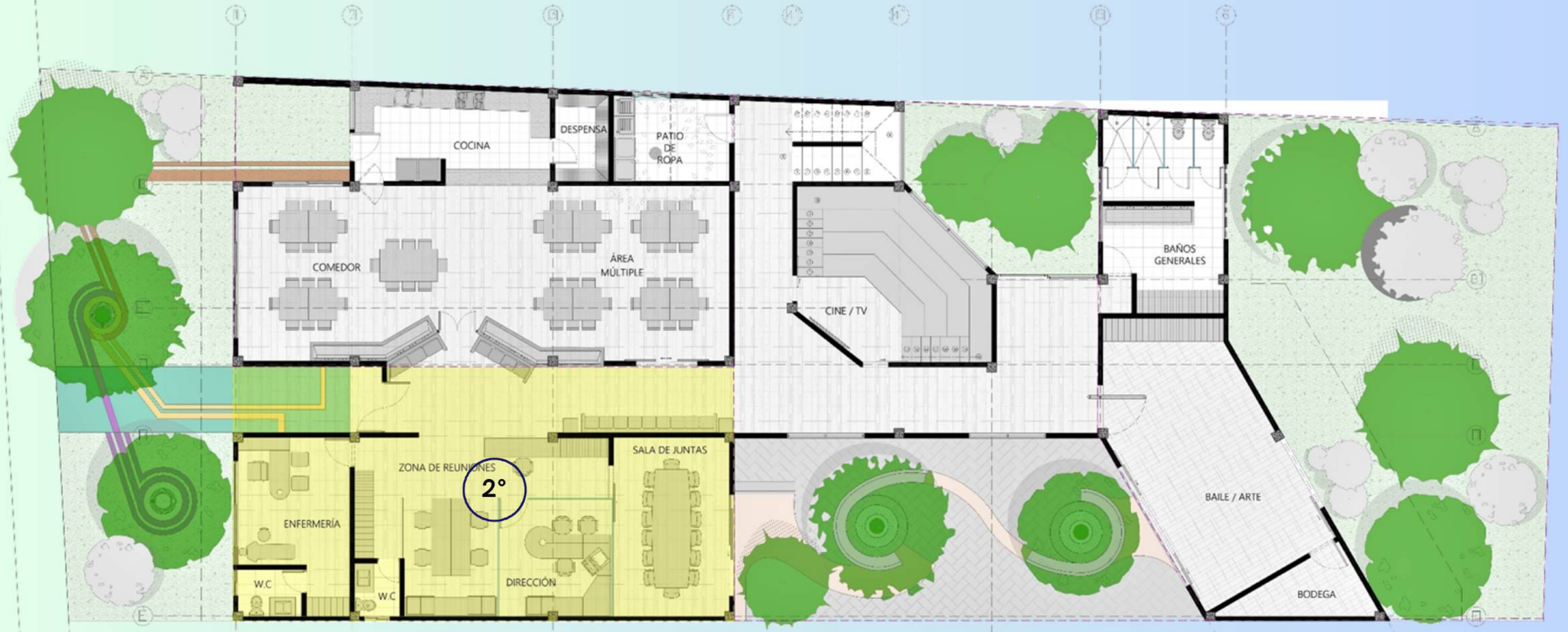
SEGUNDA ETAPA DE CONSTRUCCIÓN AREA ADMINISTRATIVA Y PÁSILLO PRINCIPAL