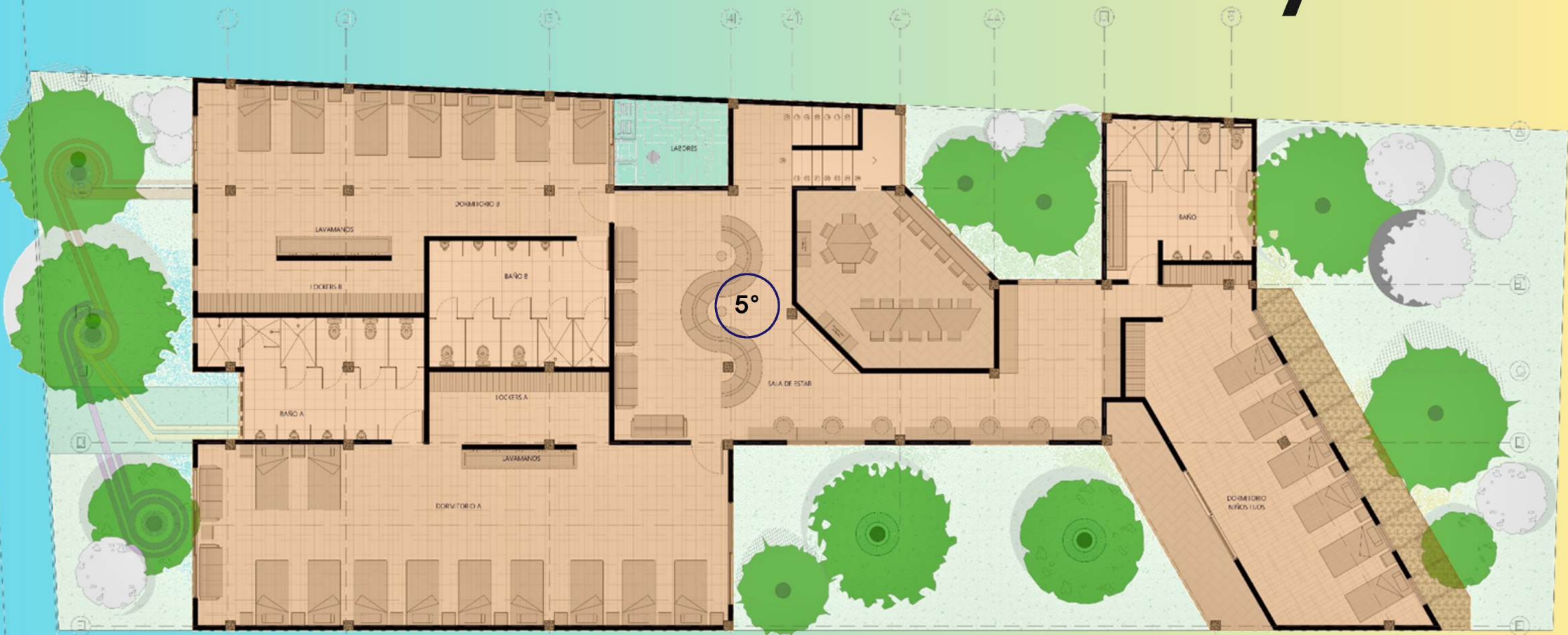
QUINTA ETAPA DE CONSTRUCCIÓN DORMITORIOS CON SUS BAÑOS, ÁREA MULTIPLE Y BIBLIOTECA