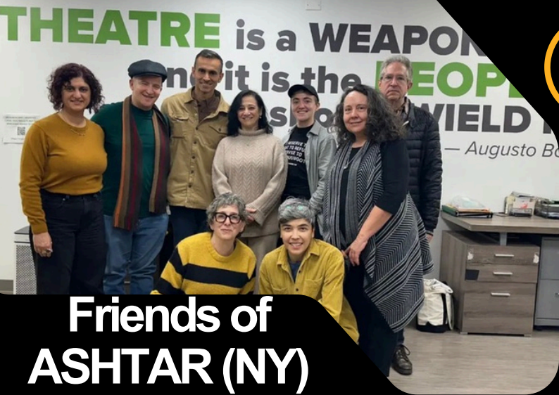
Friends of ASHTAR (NY)