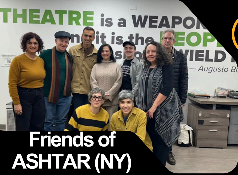
Friends of ASHTAR (NY)