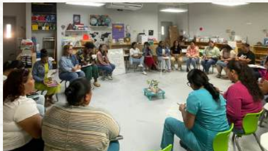
La facultad de una escuela pública Montessori en Vieques se reúne como colectivo para co-diseñar estrategias y proyectos que respondan a las necesidades de los estudiantes.