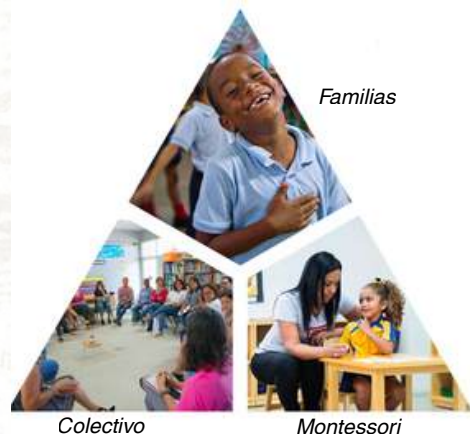
Modelo de Transformación Escolar

El Programa Académico y sus componentes sostienen la implementación de la pedagogía Montessori en las escuelas, capacitando a maestros y personal escolar en dicho modelo educativo. Paralelamente, el área de Transformación Escolar , mediante sus programas Integración Comunitaria, Asistentes Montessori, Casa Familiar y Enraizando, capacita a familias y demás miembros de la comunidad escolar en prácticas que promuevan una cultura escolar basada en la paz, el cuidado ambiental, y la democracia.