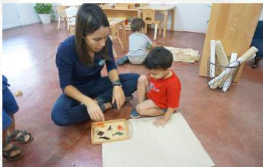
Los estudiantes reciben el acompañamiento de la guía y el asistente Montessori. Las familias tienen la oportunidad de observar esta dinámica dentro de los ambientes preparados, lo que les permite comprender cómo aprenden sus hijos mediante un enfoque integral.