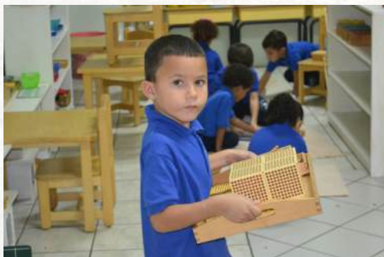
Un estudiante en una escuela pública Montessori en Carolina, con su material listo para continuar aprendiendo en un ambiente preparado para ese propósito, y guiado por un adulto capacitado y formado en la pedagogía Montessori, que acompaña su proceso respetando su ritmo y fomentando su autonomía.