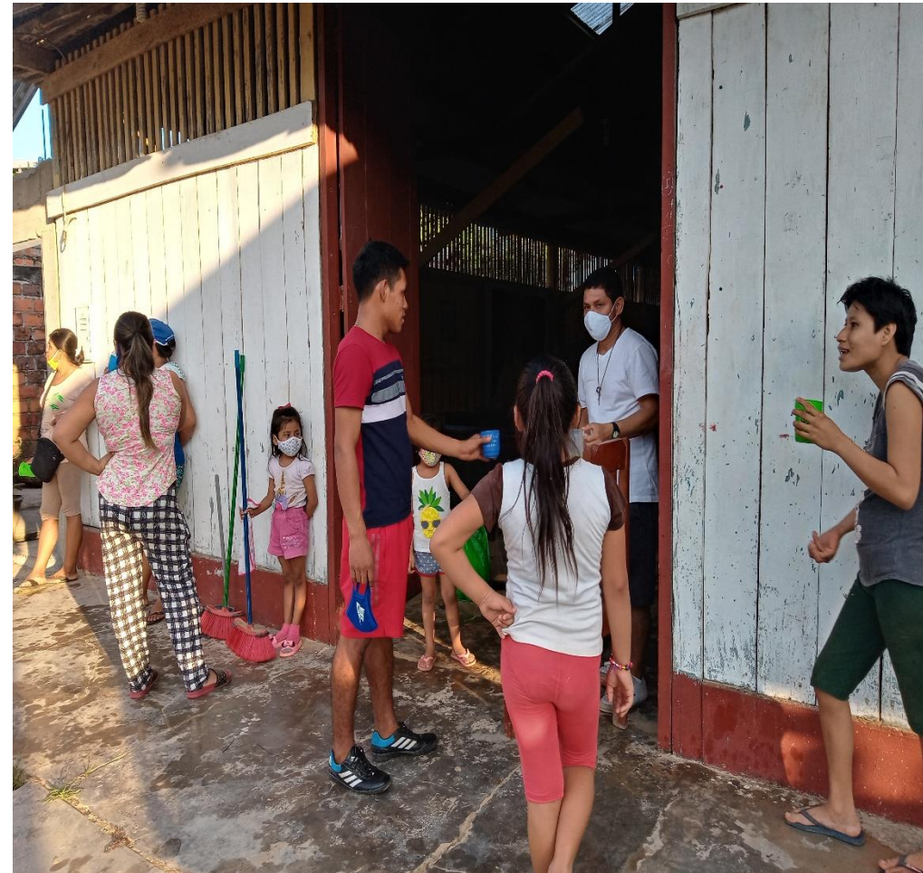
CAPILLA SAN PEDRO Y SAN PABLO QUE SE UBICA AL LADO DE LA RES. HNO POLICARPO