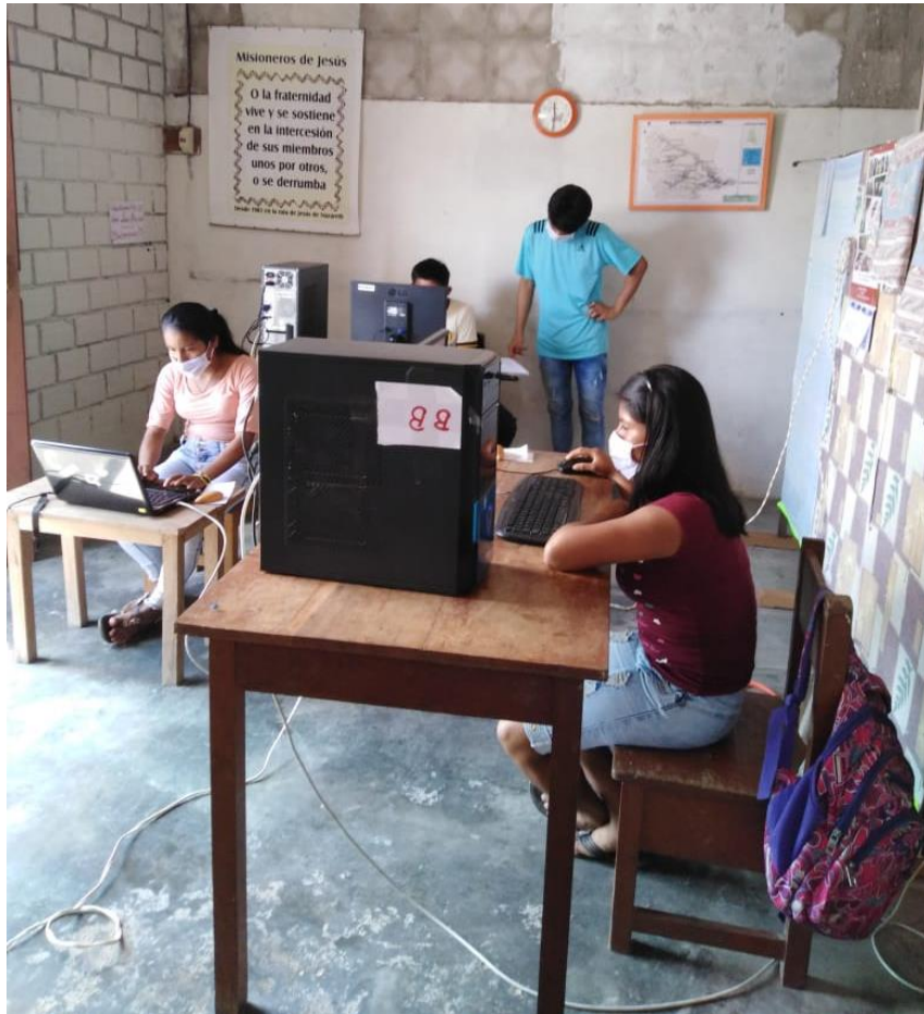
SALA DE CÓMPUTO EN LA COMUNID. BALSAPUERTO