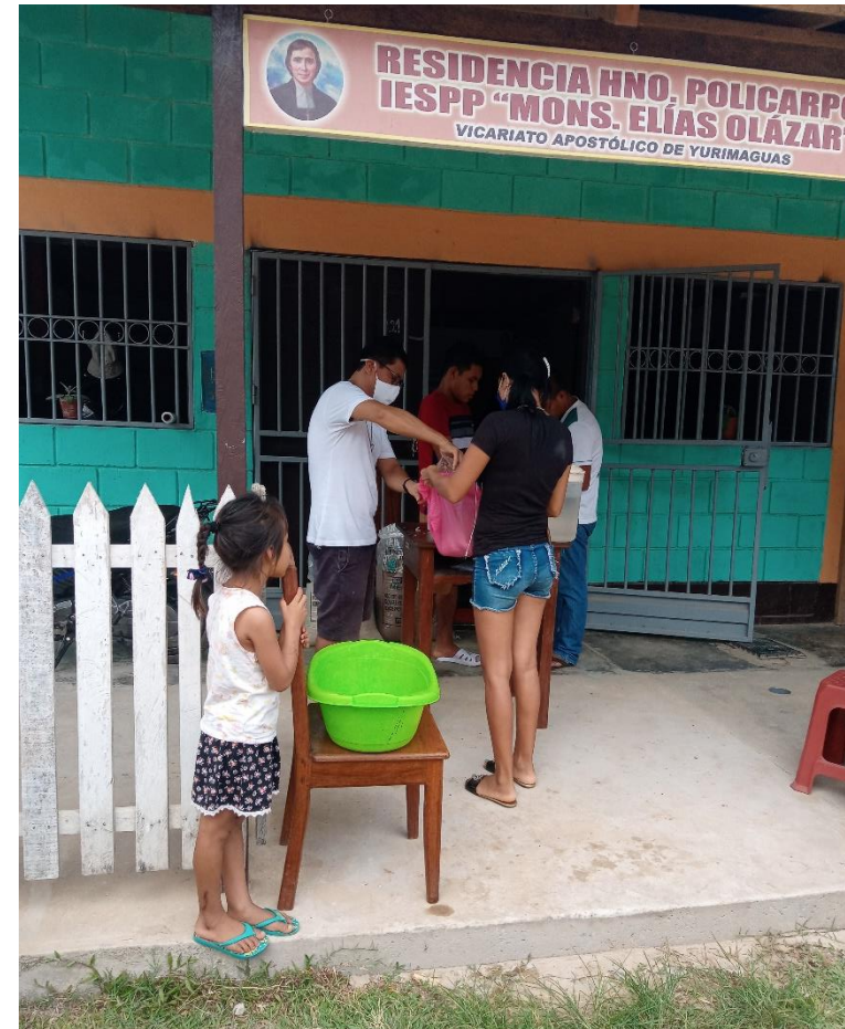
RESID. HNO. POLICARPO. COMPARTIENDO ALIMENTOS A NUESTROS ESTUDIANTES DEL IESPP "MEO".