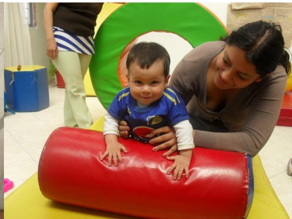
Binomio madre e hijo