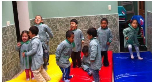
Niñ@s programa asistencia diaria