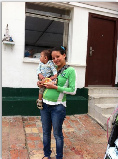
Gestante con desnutrición y anemia