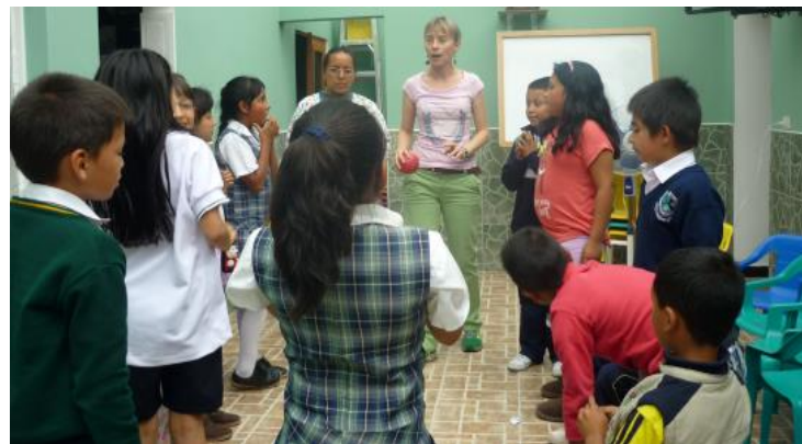
Programa almuerzo escolar