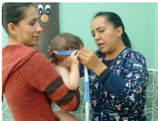
Toma de medidas antropométricas