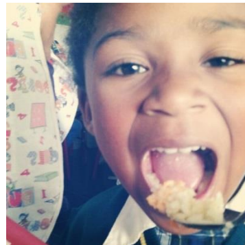
Programa almuerzo escolar