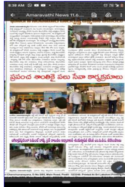
Parakasam, Andhra Pradesh