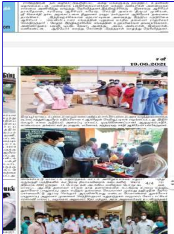
Palladam, Tamil Nadu