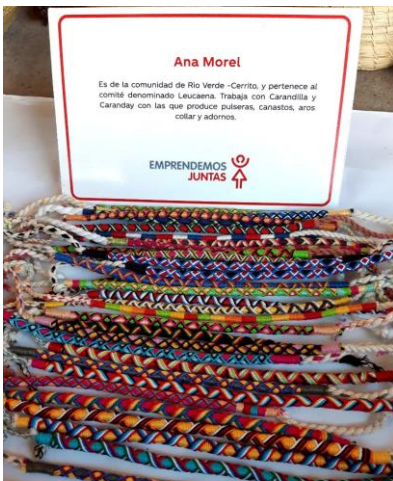
Pulseras Varias Precio: 5000 c/u