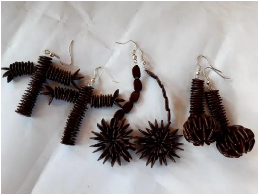
Aros de Leucaena Precio: 5.000