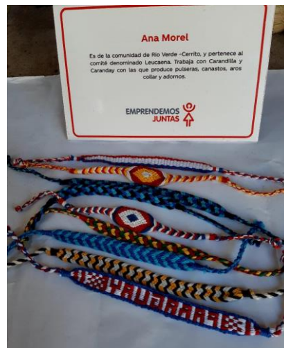
Pulseras Varias Precio: 5.000 c/u