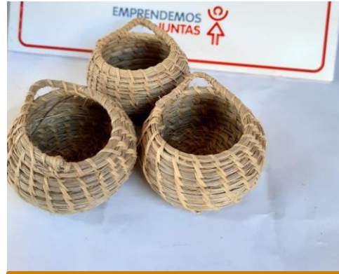
Alhajero de Karandilla chico. Precio: 5.000