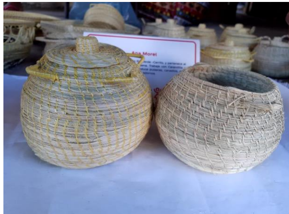
Alhajero Grande De Karandilla Precio: 40.000