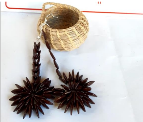
Alhajero de Karandilla con Aros de Leucaena. Precio: 15.000