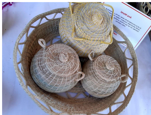
Panera de Karandilla Precio: 30.000

Para Pedidos Habilitamos el: 0975 587265