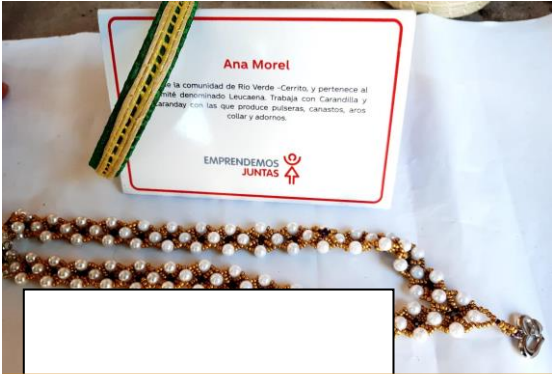
Vincha con detalles de Karandilla y Collar. Precio: 30.000