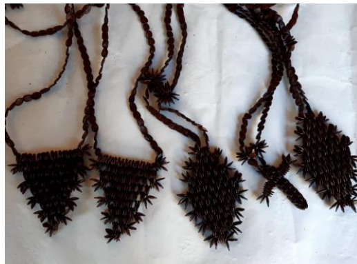
Collares de Leucaena Precio: 10.000