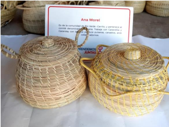
Alhajero de Karandilla Mediano Precio: 20.000