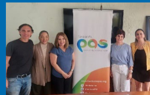
Red de Colegios Privados de Jalisco