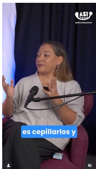
El Heraldo Podcast

Te invitamos a escuchar estos podcasts y compartirlos: cada voz informada suma a la protección.