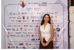
Iniciativas Un Día para Dar Jalisco