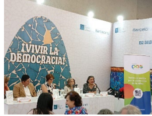
Presentación segunda edición del libro Un Secreto en Varias Voces