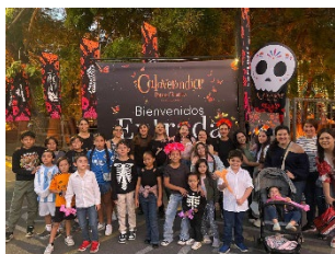
Visita a Calaverandia