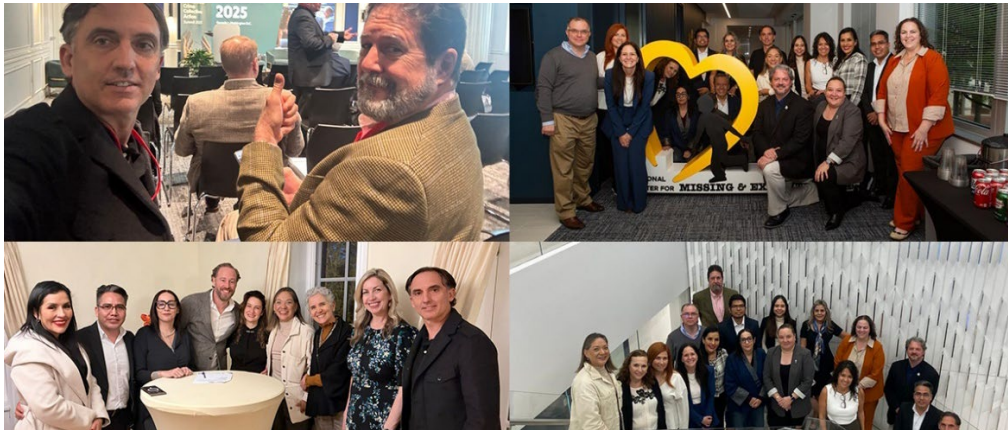
INHOPE Summit 2025, Alianzas de del Gobierno de Jalisco con NCMEC e INHOPE