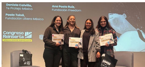
Congreso de Reinserta "Por Infancias libres de violencia sexual"

En total, sensibilizamos a más de 1,777 niñas, niños, adolescentes, cuidadores primarios, docentes y colaboradores de empresas a través de foros, conferencias, talleres y Lives gracias a: