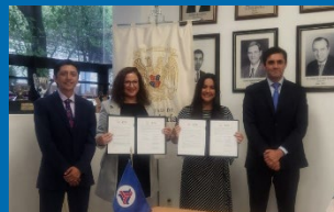
Alianza Mexicana de Ciberseguridad