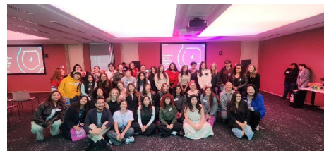
TikTok "Creadores de un internet seguro"