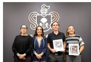
Reconocimiento por aniversario en Casa Jalisco