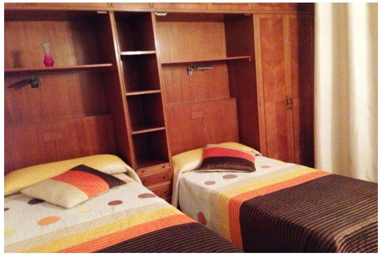
Los dormitorios tienen dos camas, sus armarios, escritorio y televisiones individuales