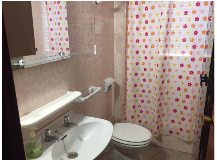
Este piso también cuenta con dos baños completos para mayor intimidad de las familias que lo habitan.