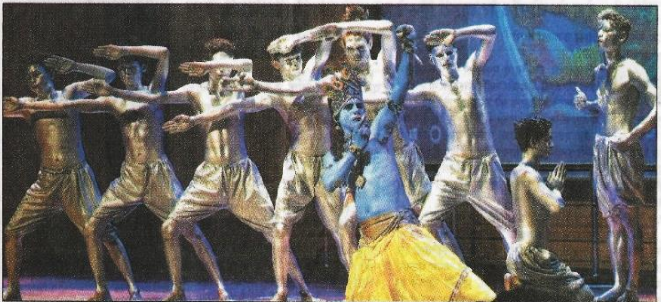
एएम सभागार में इस्कान की ओर से आयोजित कार्यक्रम में डांस प्रस्तुत करते प्रिंस ग्रुप के कलाकार। अमर उजाला

2018 की परीक्षा में अभ्यर्थी प्रभावित हो अवसर परिवर्तन बेकार हो गया है इस की पीसीएस परीक्षा मीका दिया जाए मंमफोर्डगंज में प्रतियोगियों ने यह हुआ कि इस मांग