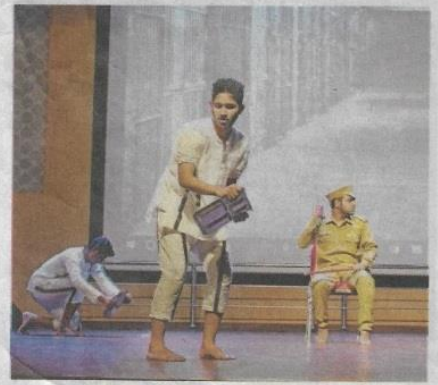
एएमए सभागार में इस्कॉन द्वारा अरोजित इंप्रेशन कार्यक्रम में नशा मुक्ति पर आधारित नाटक प्रस्तुत करते छात्र