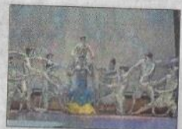
Event under way.