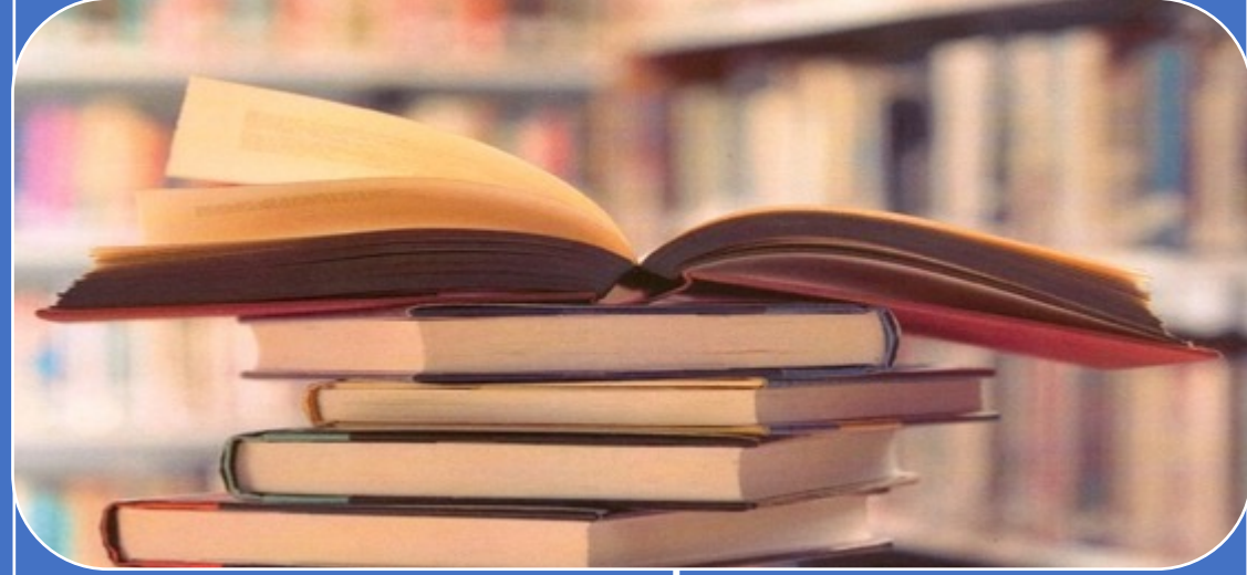
50,300+ Books sponsored