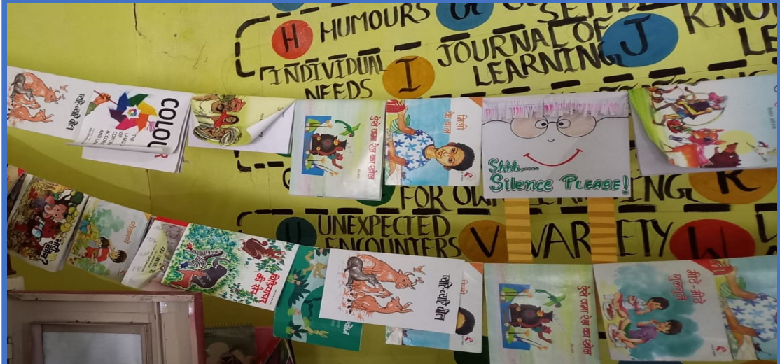
166 Libraries in India, 18 in Kenya, 3 in Nepal