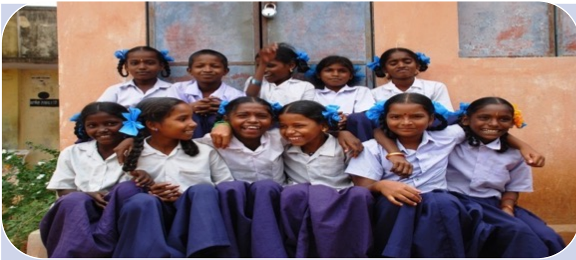
35,280+ Children positively benefited