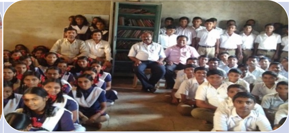
20+ New Schools in progress