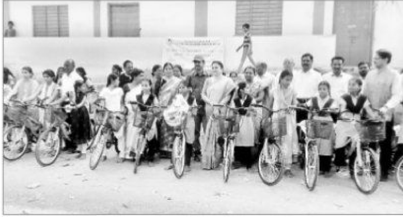
బాలికలకు సైకిళ్లను పంపిణీ చేస్తున్న అధికారులు, ఉపాధ్యాయులు