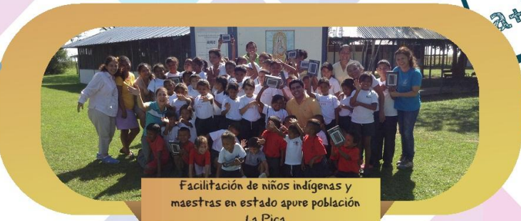
Facilitación de niños indígenas y maestras en estado apure población La Pica