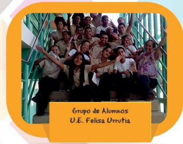
Grupo de Alumnos U.E. Felisa Urrutia