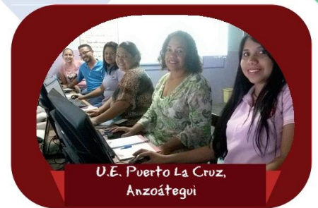
U.E. Puerto La Cruz, Anzoátegui