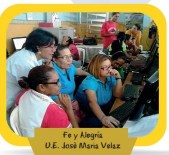
Fe y Alegría U.E. José María Velaz