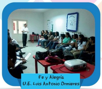
Fe y Alegría U.E. Luis Antonio Ormieres