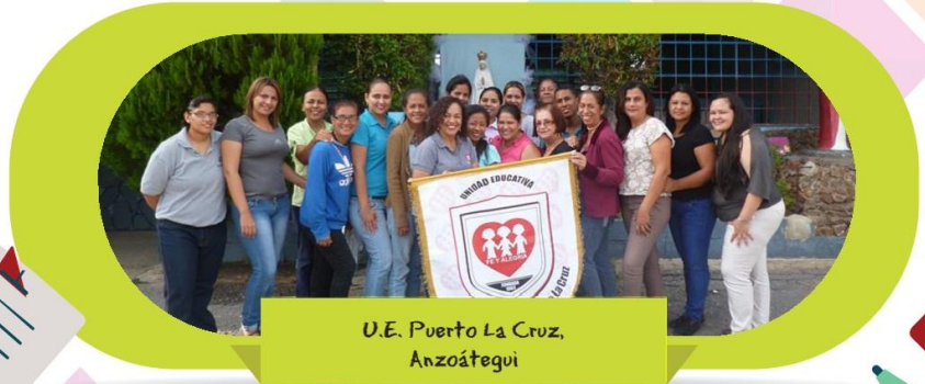
U.E. Puerto La Cruz, Anzoátegui