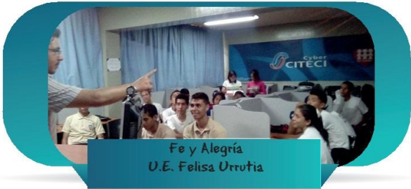
Fe y Alegría U.E. Felisa Urrutia

En esta etapa inicial trabajamos con varias escuelas de Fe y Alegría de la región Oriente, Aragua y Caracas; Además en la comunidad La Pica y escuelas municipales en el Edo. Miranda. A través de dicho modelo, los docentes se convierten en agentes multiplicadores para que los niños y jóvenes superen la brecha digital y accedan a las nuevas tecnologías del siglo XXI.