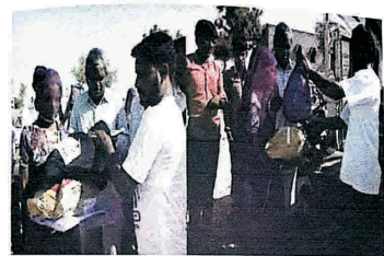
बाड़मेर टाइम्स नेटवर्क(25/09/2017)