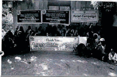
अजमेर: रा. धोरीमन्ना