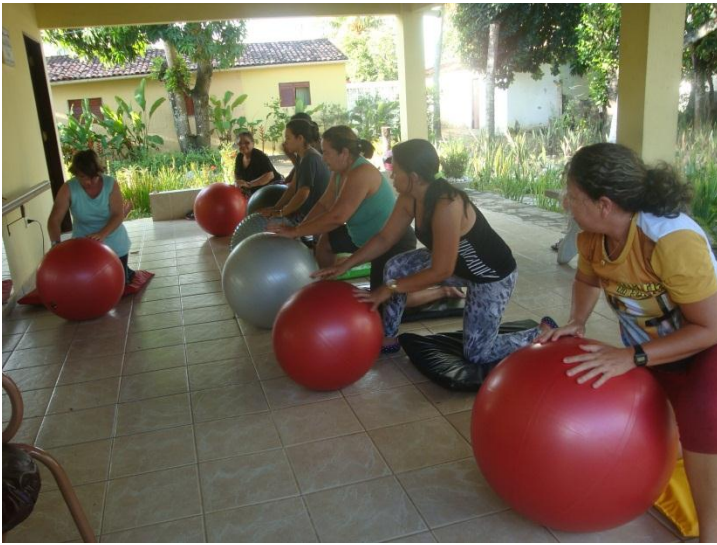
Atividades terapêuticas e recreativas Com as mães das crianças