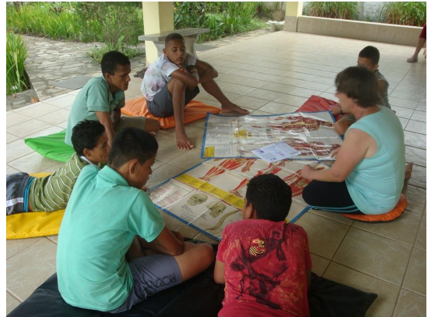
Oficinas de Formação