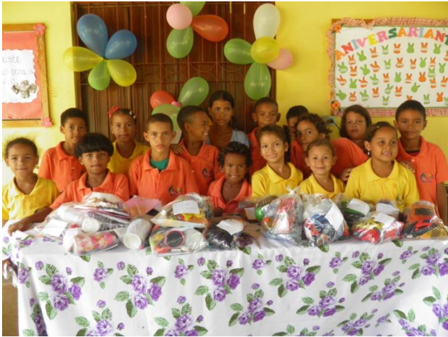
Celebração de Aniversários