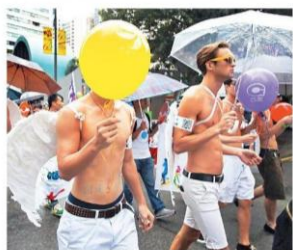
■有男性參加者惡心裝扮，表示「同志」生活可以很精采。