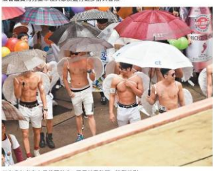
■有參加者穿上天使翼裝束，展現結實胸肌，造型特別。

由香港女同盟會、香港彩虹等關注同性戀者權益的團體，發起本年度的同志遊行，主題是為「肯定定要撐一尊重差異，踢走歧視」。希望政府就反歧視法進行公眾諮詢，並儘快推出草案。大會表示，遊行有8,900人參加，警方稱最高峰時有4,700人參與，平機會主席周一嶽亦有參與遊行，表示今次遊行倡導多元共融的價值觀，正是平機會宗旨之一，又認為自己若不參加就是不負責任。政府回應指，現時諮詢的極具爭議，會繼續與民間溝通。