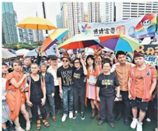
■三位代表本年度同志遊行的彩虹大使，平機會主席周一嶽、歌手何韻詩及立法會議員何秀蘭與大家於遊行起點夏聲道合照。