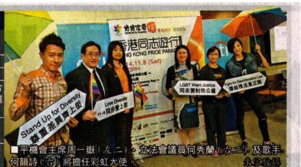
■平機會主席周一嶽(左二)、立法會議員何秀蘭(右三)及歌手何韻詩(右)將擔任彩虹大使。

主題： 肯定定要撐一 尊重差異 踢走歧視 日期： 今年11月8日 集合時間： 下午2時 遊行路線： 維園1號足球場集合 →軒尼詩道→金鐘 添馬公園 衣着主題： 同志橙 (Queer Orange) 資料來源： 香港同志遊行2014 籌委會