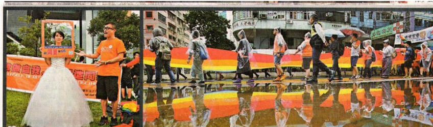
■小德蘭(左)的前夫也是同志，她希望社會不要逼同志走進異性戀關係的困局。

「我希望校園內的同志可以有所改變，例如多一些無性別廁所，或者多給同志一些空間，因為我們終會接受我，因為我們終是他們的兒子。」