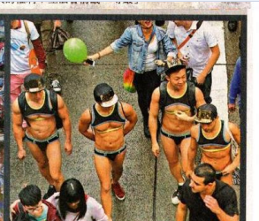
■象徵性少數群體的彩虹旗為同志遊行打頭陣。