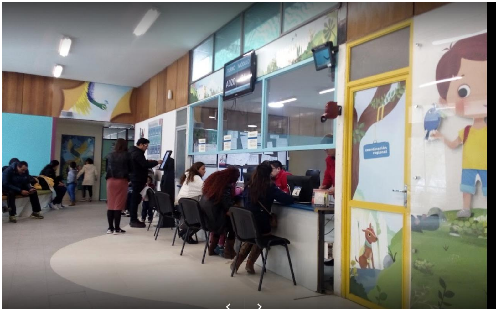
Clinic Registration Area