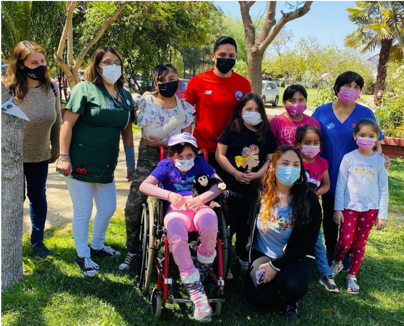
Kids and Staff