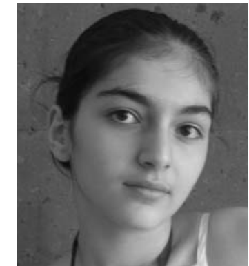
GLOW-ից հետո սկսել եմ առողջ ապրելակերպ վարել, կյանքի նկատմամբ լցված եմ լավատեսությամբ: Որոշել եմ մասնագիտանալ երկու ուղղություններով՝ դառնալ տնտեսագետ և հոգեբան:

GLOW-ն օգնում է հոգևոր, ֆիզիկական, մտավոր զարգացմանը, հասարակական պոտենցիալի և բնավորության ձևավորմանը: Ես մի գործ ձուտիկ էի, ով չէր կարողանում առանձնանալ հոծ բազմությունից, իսկ այժմ ես լիովին ուրիշ մարդ եմ՝ նոր կյանքով, նոր գաղափարներով և նոր հաջողություններով: