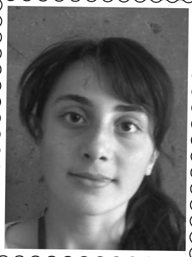
Աշխեն Առաքելյան գյուղ Խնձորեսկ, Սյունիքի մարզ

Առաջին օրը թիմերի բաժանվելով տվեցիք տարբեր անվանումներ, ծանոթացանք առկա կետերին և նախապայմաններին, ընտրեցինք մի ընդհանուր պար, որը եղավ այդ հանդիպման վերջաբանը: