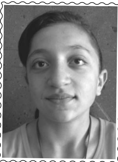
Փաղունց Նվարդ գյուղ Խնձորեսկ, Սյունիքի մարզ

Ես շնորհակալություն եմ հայտնում բոլոր կազմակերպիչներին, որոնք պայքարել են այս ծրագրի համար: Շնորհակալ եմ նրանցից, ովքեր 8 օր շարունակ մեր կողքին էին և հոգ էին տանում մեր մասին: